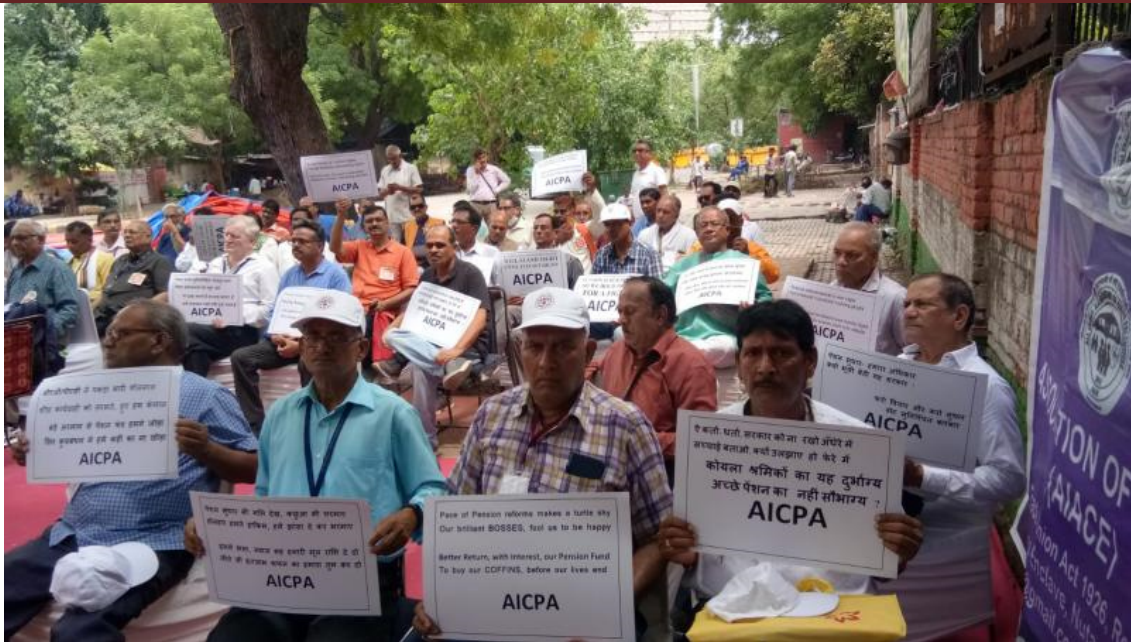
अखिल भारतीय कोयला पेंशनभोगी संघ (एआईसीपीए) विशाल धरना प्रदर्शन हम यही भूखे प्यासे रहेंगे... नई दिल्ली जंतर